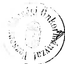
Szabó Ferenc Polgármester